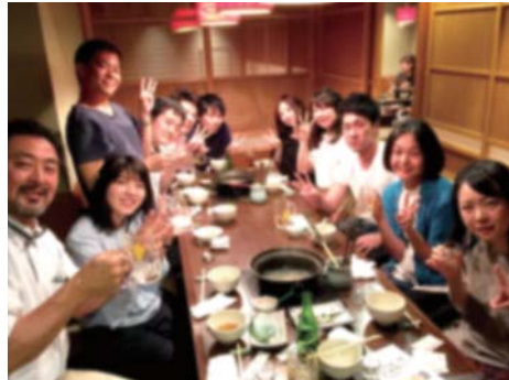
▲これまでのみえフェスの様子